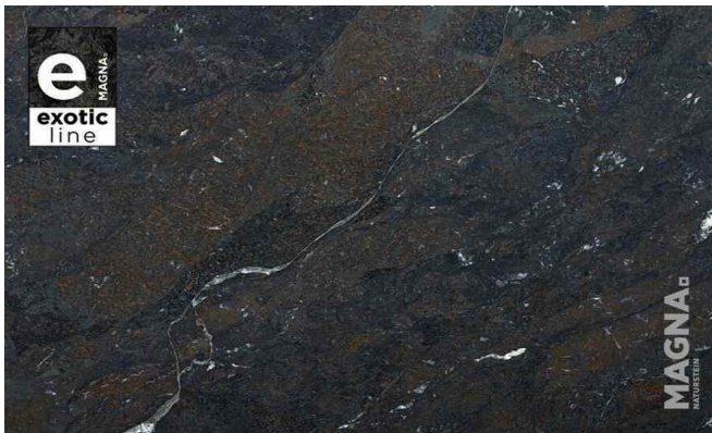
Brechia Imperiale (Amarula)

Herkunft: Brasilien Gesteinsart: Metamorphit | Mylonit Verwendung: Innenbereich trocken + nass Besonderheit: Sanfte, warme Farbtöne von Kaffee- bis Kastanienbraun, durchzogen von weißen Aderungen.